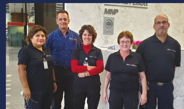
Équipe de jour

Nos équipes d'entretien ménager de chez GDI œuvrent en arrière-scène de jour comme de soir. Nous remercions chaleureusement chacun des membres des équipes d'entretien qui suscitent le bien-être et la fierté au sein de l'immeuble.