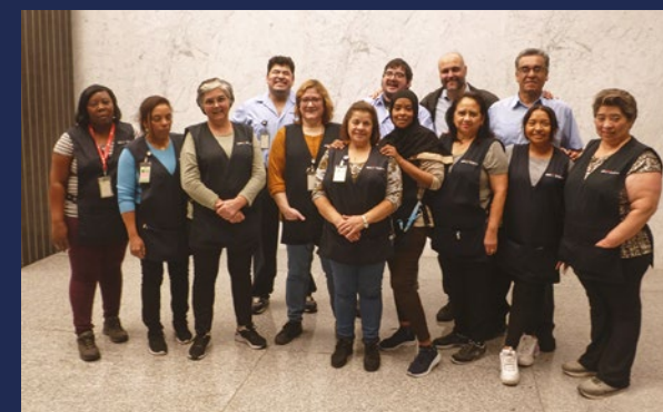
Équipe de soir