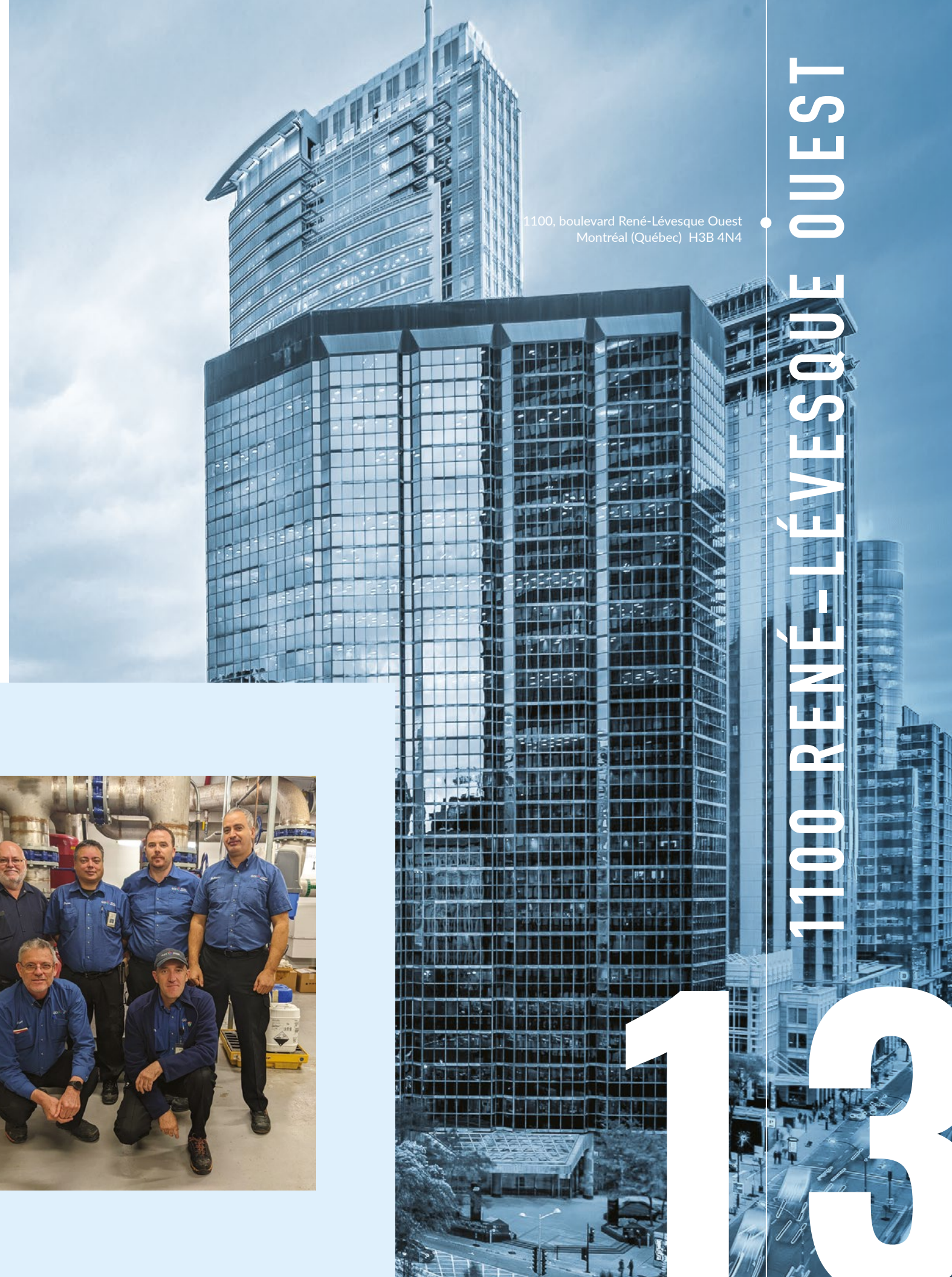
1100, boulevard René-Lévesque Ouest Montréal (Québec) H3B 4N4