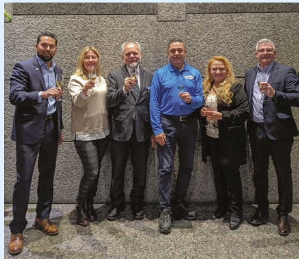
Toute l'équipe du 555 RLO

À l'occasion de la nouvelle année, l'équipe du Complexe 555 RLO tient à vous souhaiter ses meilleurs vœux de bonheur, de santé, et de réussite. Que l'année à venir se déroule sous le signe de la collaboration et du bien vivre ensemble!